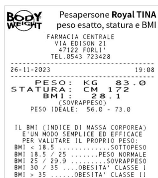
Esempio di biglietto