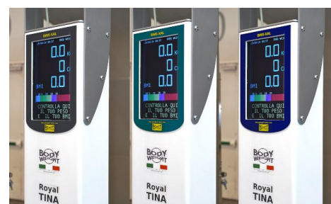
Royal Tina è disponibile con i pannelli in 3 colori: grigio, azzurro e verde